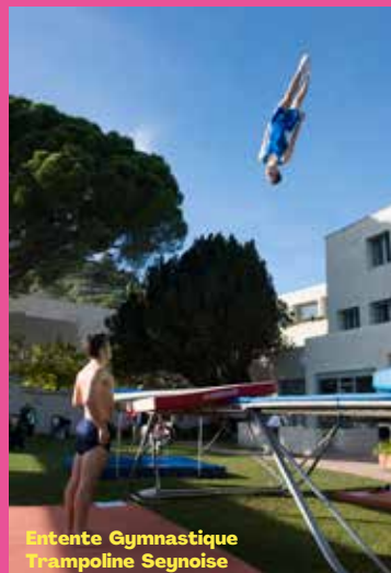
Entente Gymnastique Trampoline Seynoise