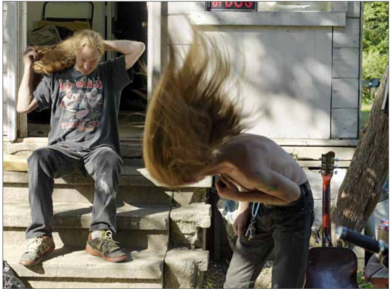
USA, Datazone Flint 19 Série Drive Thru 2015