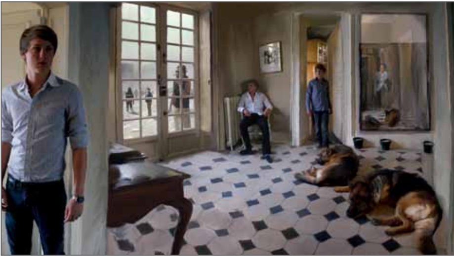
"Le bruit du monde", 2010