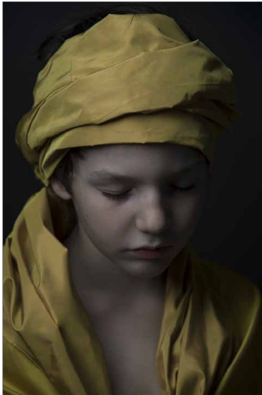
"Precious Silence", 2015 © Danielle Van Zadelhoff